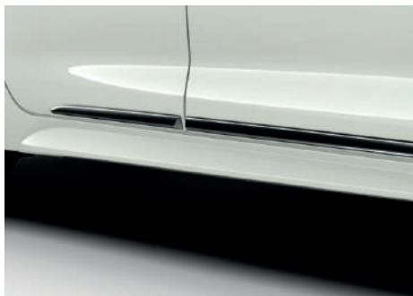
Хромовані молдинги дверей