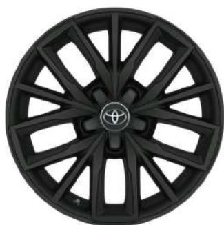
Легкосплавний диск 17", чорний