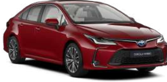
3U5 Червоний, перламутр