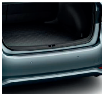
Захисна плівка заднього бампера, прозора