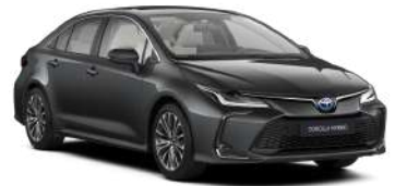
1G3 Сірий, металік