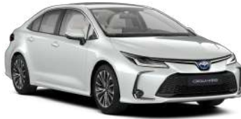
089 Білий, перламутр