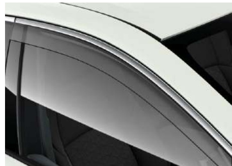
Дефлектор вікон з хромованим окантуванням