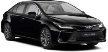
209 Чорний, металік