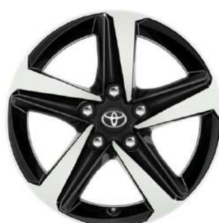
Легкосплавний диск 16", чорний з механічно обробленою поверхнею