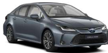
1K3 Сіро-блакитний, металік