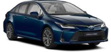
785 Темно-бірюзовий, металік