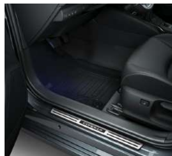
Алюмінієві накладки порогів