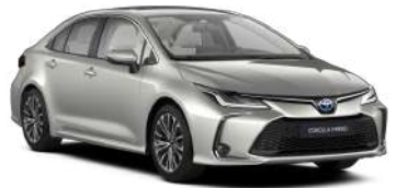
1J6 Платиновий, перламутр новий