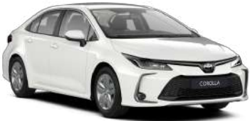
040 Білий, лак