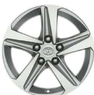
Легкосплавний диск 16", сріблястий