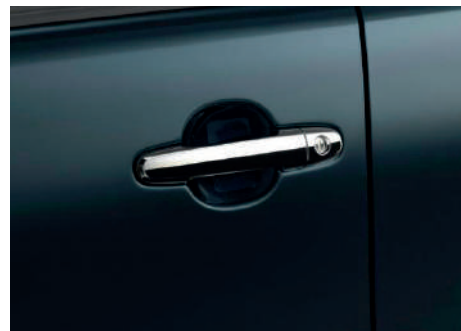
Захисна плівка під ручки дверей