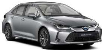
1L0 Сріблястий, металік