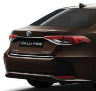
Хромована накладка кришки багажного відділення