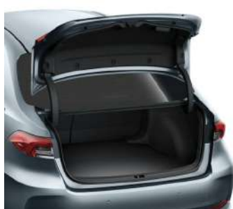
Килимок багажного відділення, текстильний