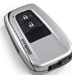
Чохол ключів з логотипом Hybrid