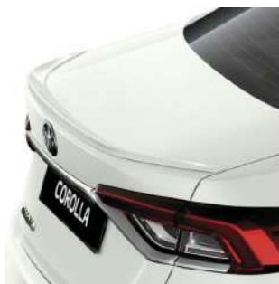
Спойлер кришки багажного відділення