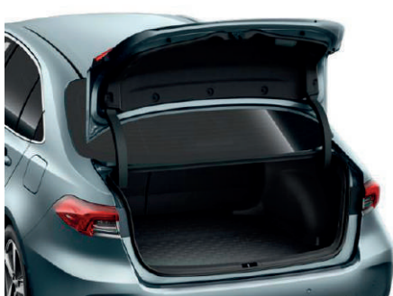
Килимок багажника, гумовий