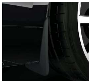
Комплект передніх та задніх бризговиків