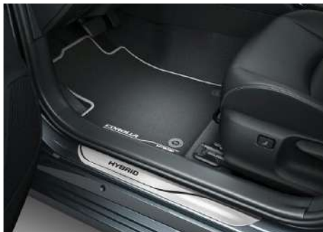
Килимки салону, текстильні з логотипом